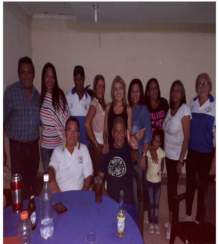
ACTIVIDAD DEPORTIVA 53 ANIVERSARIO CLADEF